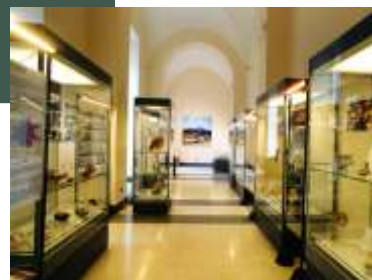
Museo di Antropologia

Attività per la Scuola Media e Superiore