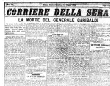
L'articolo sulla morte dell'eroe