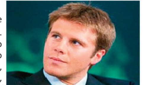
Emanuele Filiberto di Savoia ospite in un talk-show

Cominciamo dal più conosciuto dal pubblico italiano, Emanuele Filiberto di Savoia, pronipote diretto del re Vittorio Emanuele II. Entra in scena in Italia dal 2002, quando termina l'esilio imposto ai Savoia, e subito cerca attirare l'attenzione degli italiani, avendo perso ormai la "corona d'Italia". È ospite a numerosi talk-show, dove esibisce un italiano davvero barcollante per un nobile, come barcollante è anche la sua andatura dopo feste e ricevimenti importanti. Ha esibito qualche passo di danza nel programma condotto dalla Carlucci "Ballando con le stelle" e ha partecipato a una delle ultime edizioni di Sanremo come concorrente al fianco del "noto" cantante Pupo dove, con la canzone "Italia amore mio", è riuscito ad arrivare al terzo posto. Tenta anche la carriera politica fondando un movimento d'opinione "Valori e Futuro", che però ha vita breve. Da qui il principe si dedica interamente ed esclusivamente al mondo dello spettacolo. Sembra chiaro che del-