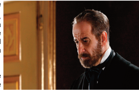
Giuseppe Mazzini durante l'intervista con il nostro inviato

Ringraziamo l'eroe per la sua disponibilità. Ad un tratto il fumo dalla pipa di Mazzini si fa più denso, come una nebbia. Non si riesce a vedere nulla. Quando la foschia si dirada, del patriota italiano non è rimasto niente, se non l'odore forte del tabacco che tanto amava.