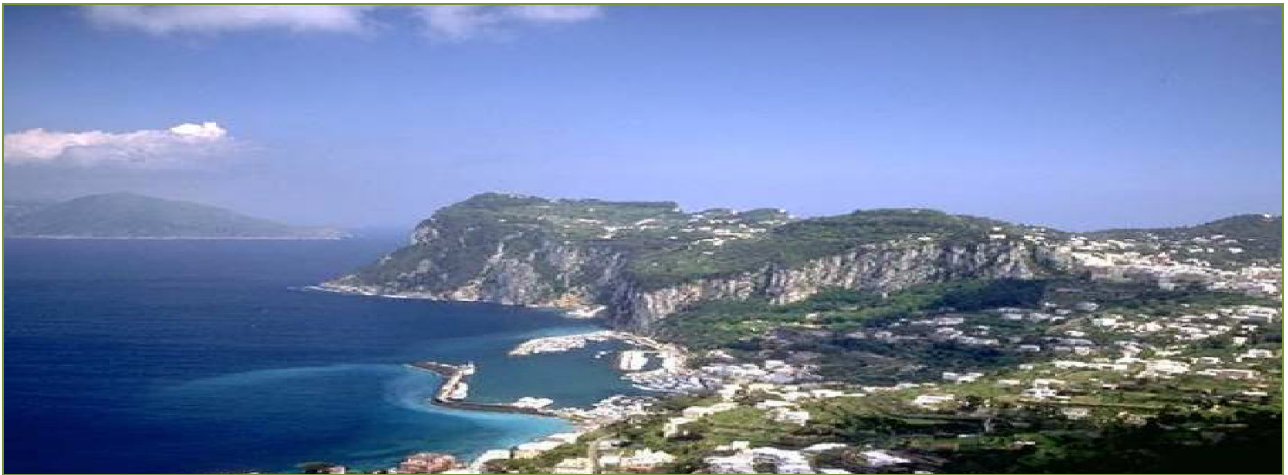
Immagine di Marina Grande a Capri dove arrivano i traghetti – vista da Anacapri